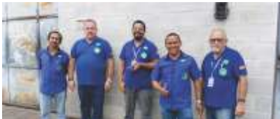
Diretores em atendimento...