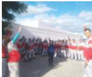
Visita aos trabalhadores da Itaipava - barbalha - Cariri