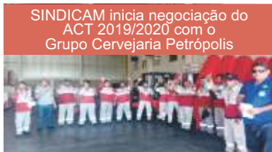
SINDICAM inicia negociação do ACT 2019/2020 com o Grupo Cervejaria Petrópolis