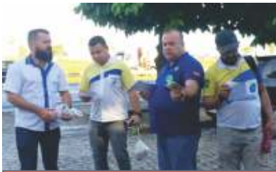
Reunião realizada com os trabalhadores da Transvale