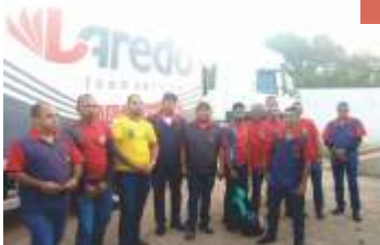
SINDICAM-CE promove dia de sindicalização em Juazeiro do Norte.