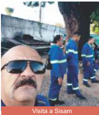
Visita a Sisam