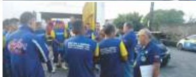
Diretoria em atendimento na base