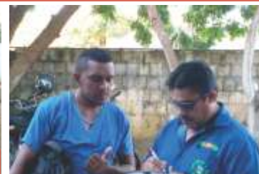
Visita na Replama